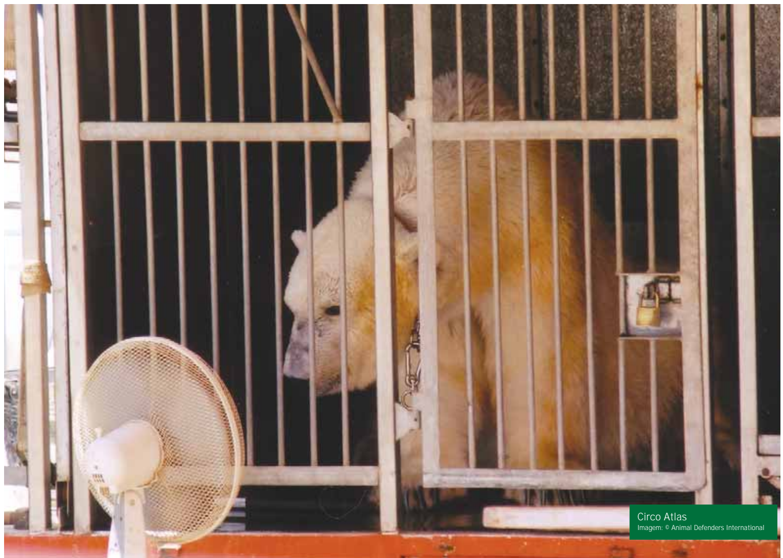
Circo Atlas