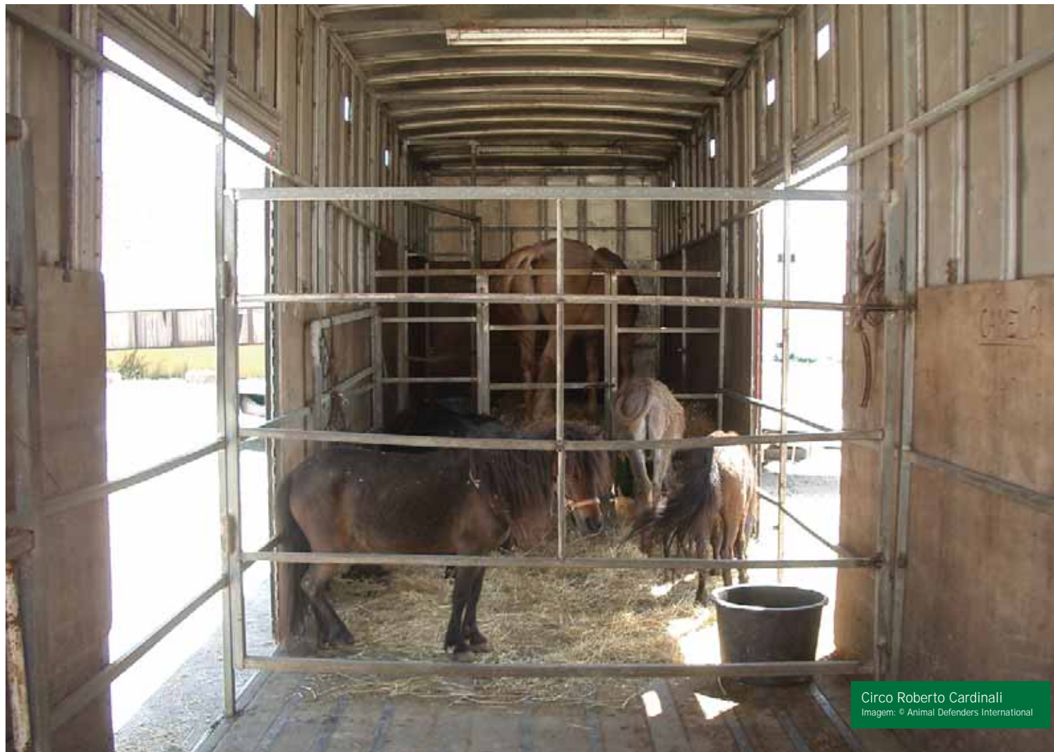
Circo Roberto Cardinali