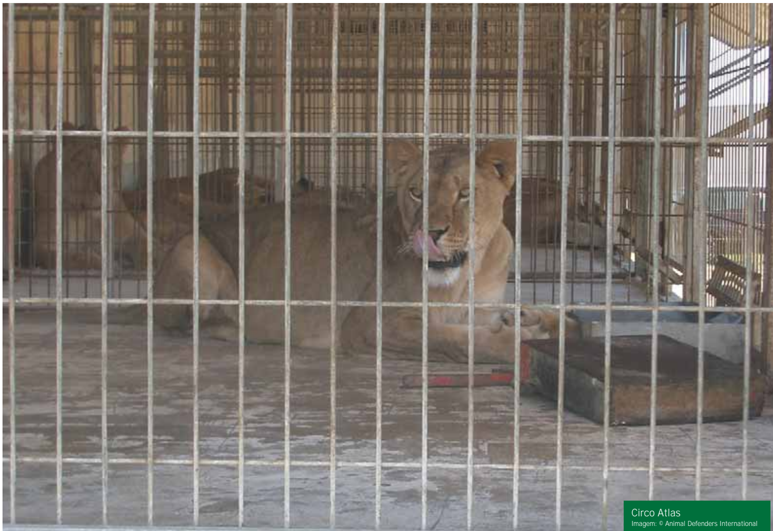
Circo Atlas