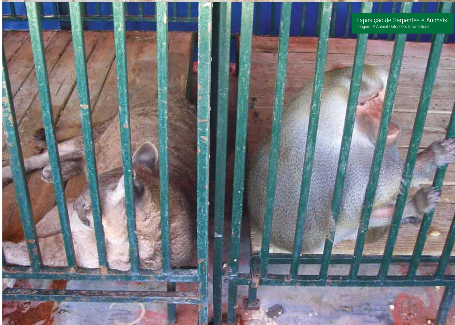
Exposição de Serpentes e Animais