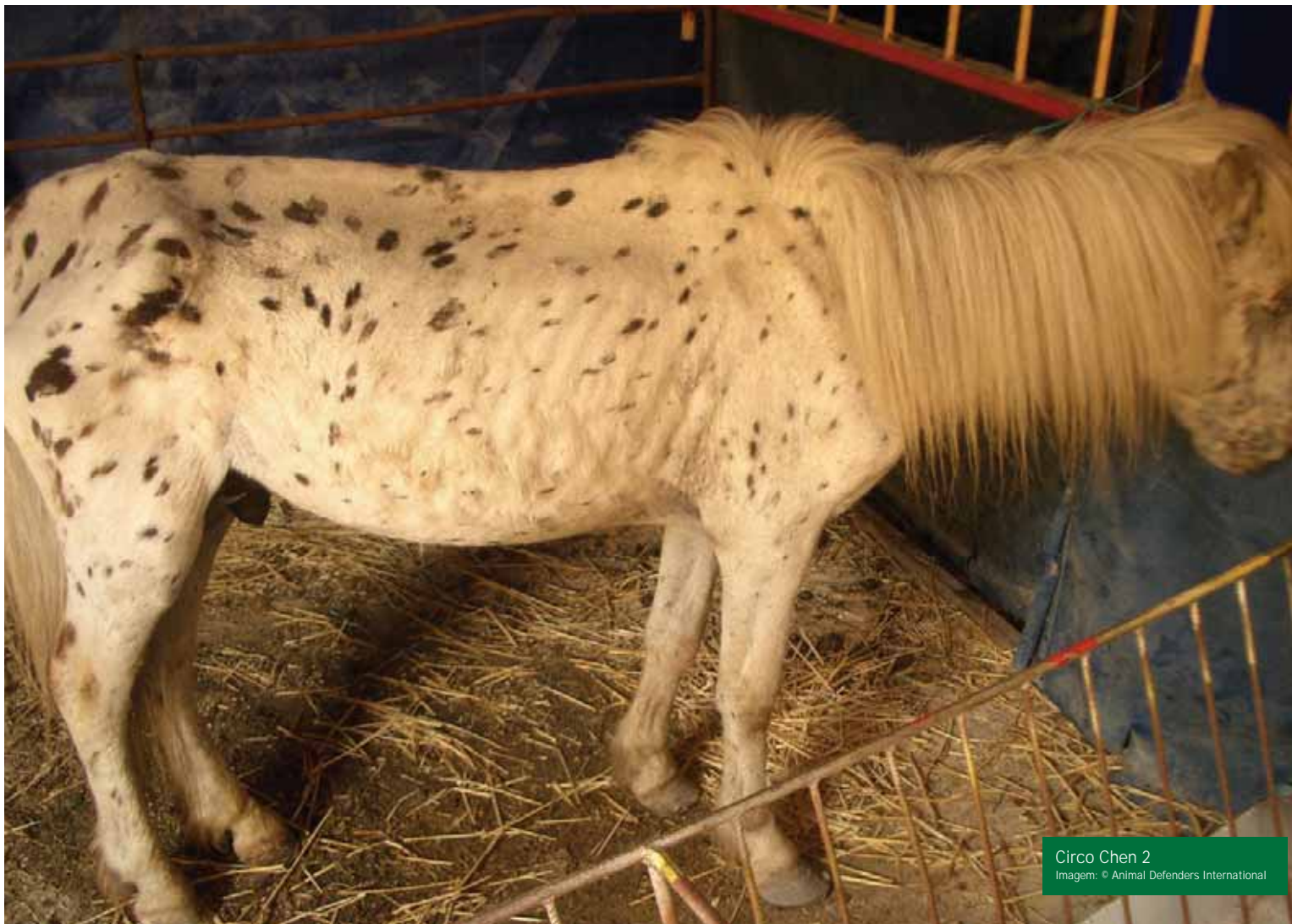
Circo Chen 2