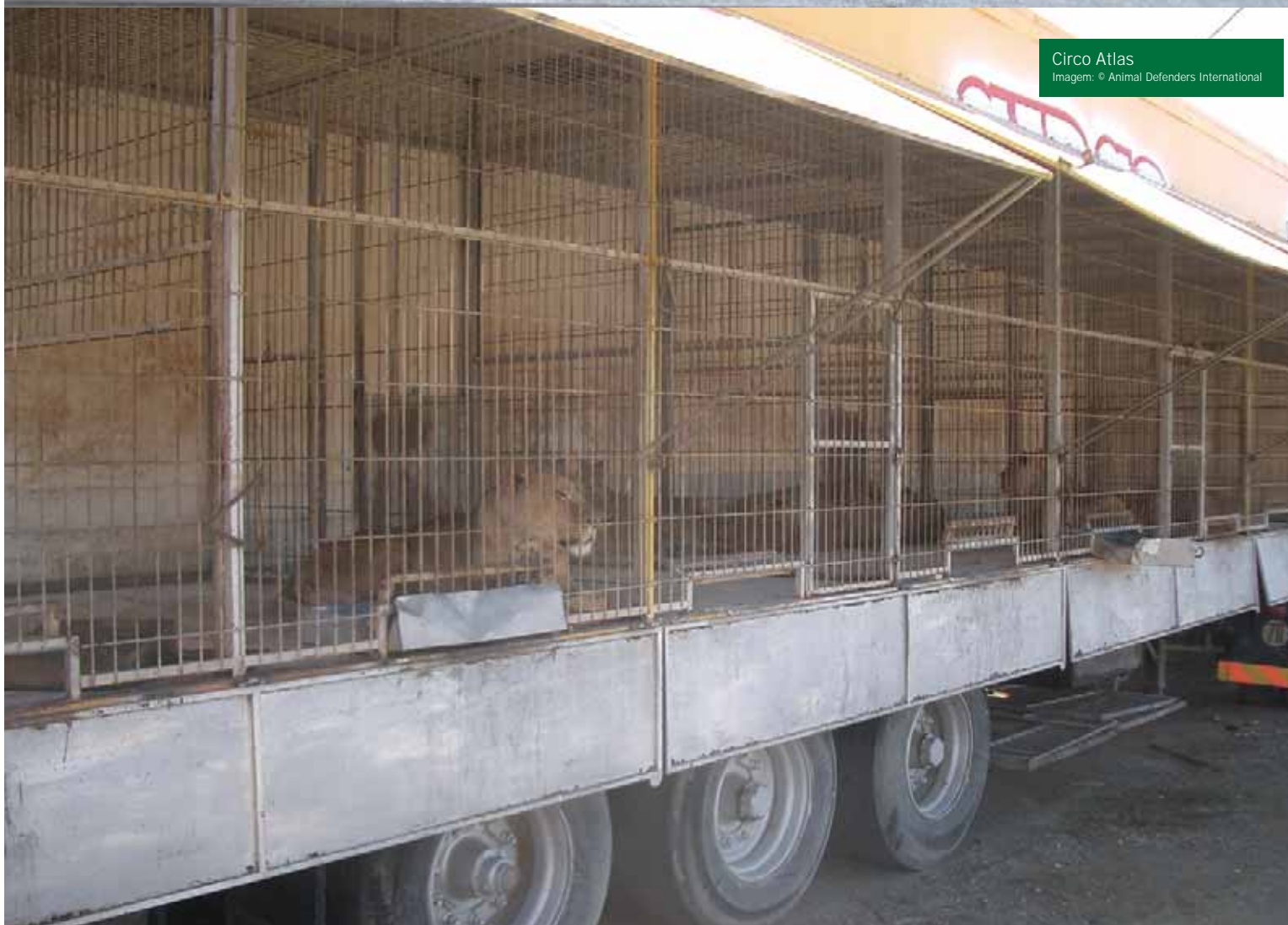
Circo Atlas