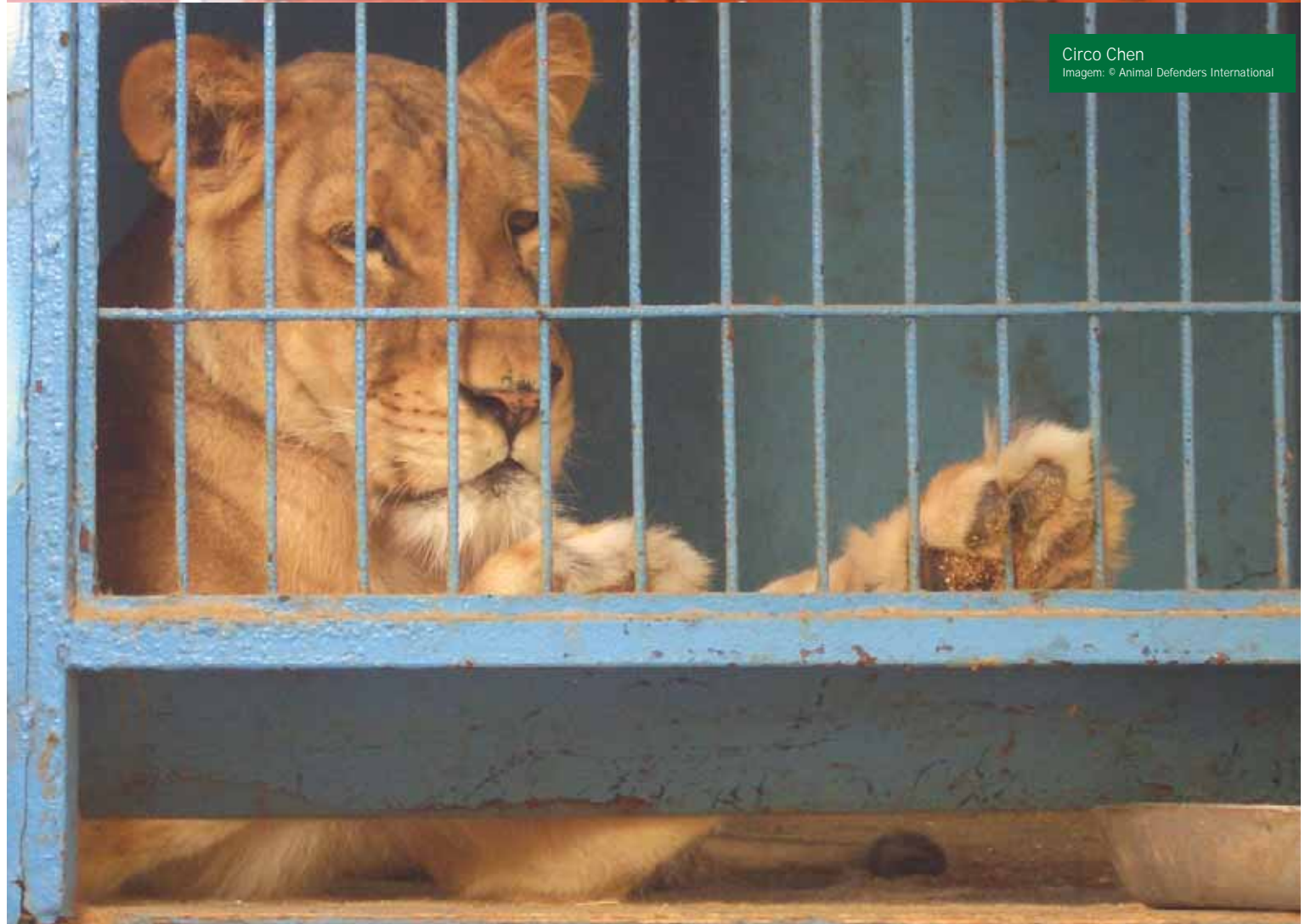
Circo Chen