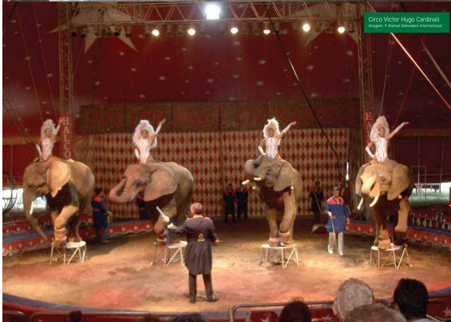
Circo Victor Hugo Cardinali