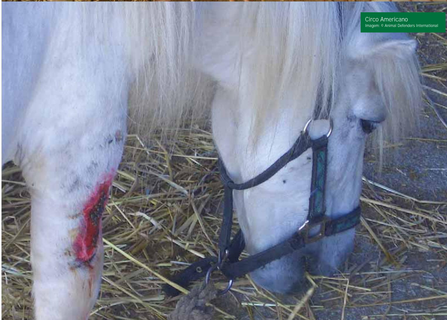
Circo Americano