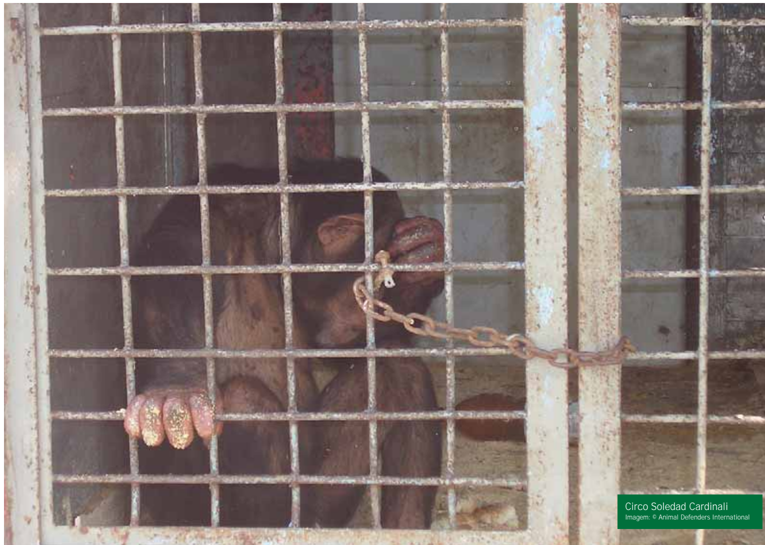
Circo Soledad Cardinali